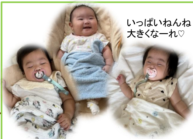
いっぱいねんね 大きくなーれ♡