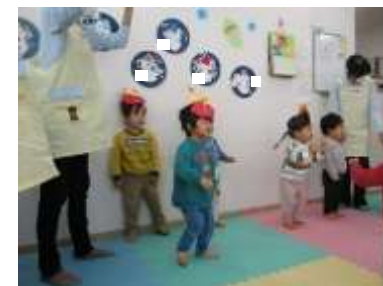
♪おにのパンツはいいパンツ～♪