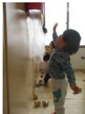
やったー！！当たったぞ！