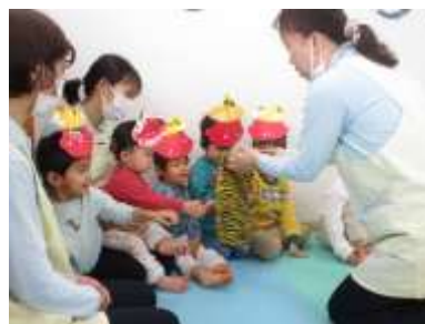
おにのパンツはトラの毛皮で できてるんだって～