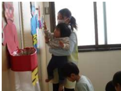
リンリン～♪すずくに当たるといい音がするね！