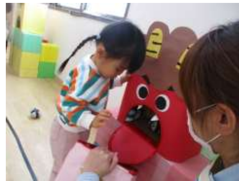
おにさん、たくさんたべてね！どうぞ～