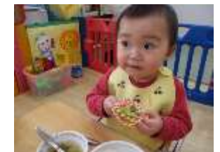
ブロッコリーもおいしいよ