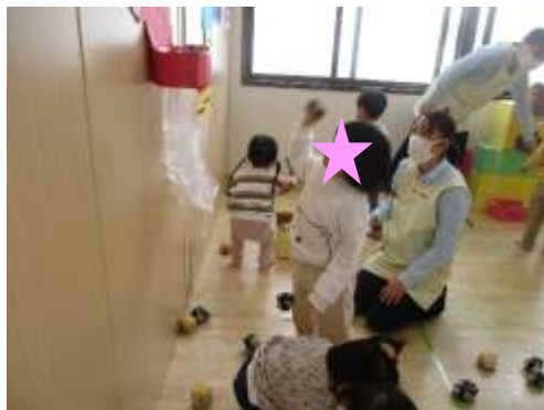
おにさんの的あて、たのしいな！！