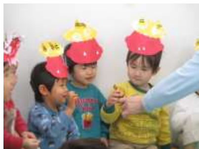
おにさんの角をさわってみよう