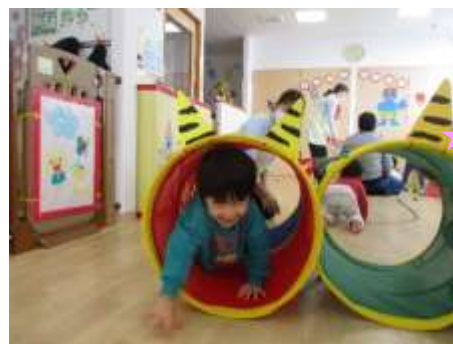
おにさんのトンネルをくぐってあそんだよ！まてまて～！