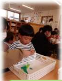
はさみで一回切り