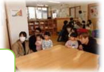
朝の会 すうじのうたが 好きなこどもたち♪