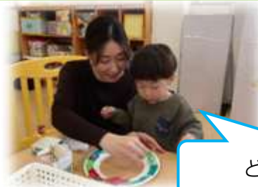
どこに貼ろうかな