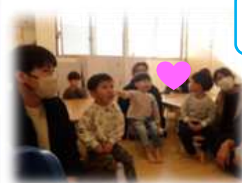
すうじの1はなあと♪